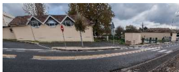
A - Arrêt minute simulé Avenue de l'Esprit des Lois