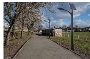
B - Piste actuelle avec éclairages autonomes simulés

Aménager des pistes multifonctions (piétons et vélos) chemin d'Eyquem, avenue de l'Esprit des Lois jusqu'à l'arrêt de bus avec parking vélos à proximité.